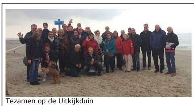
Tezamen op de Uitkijkduin